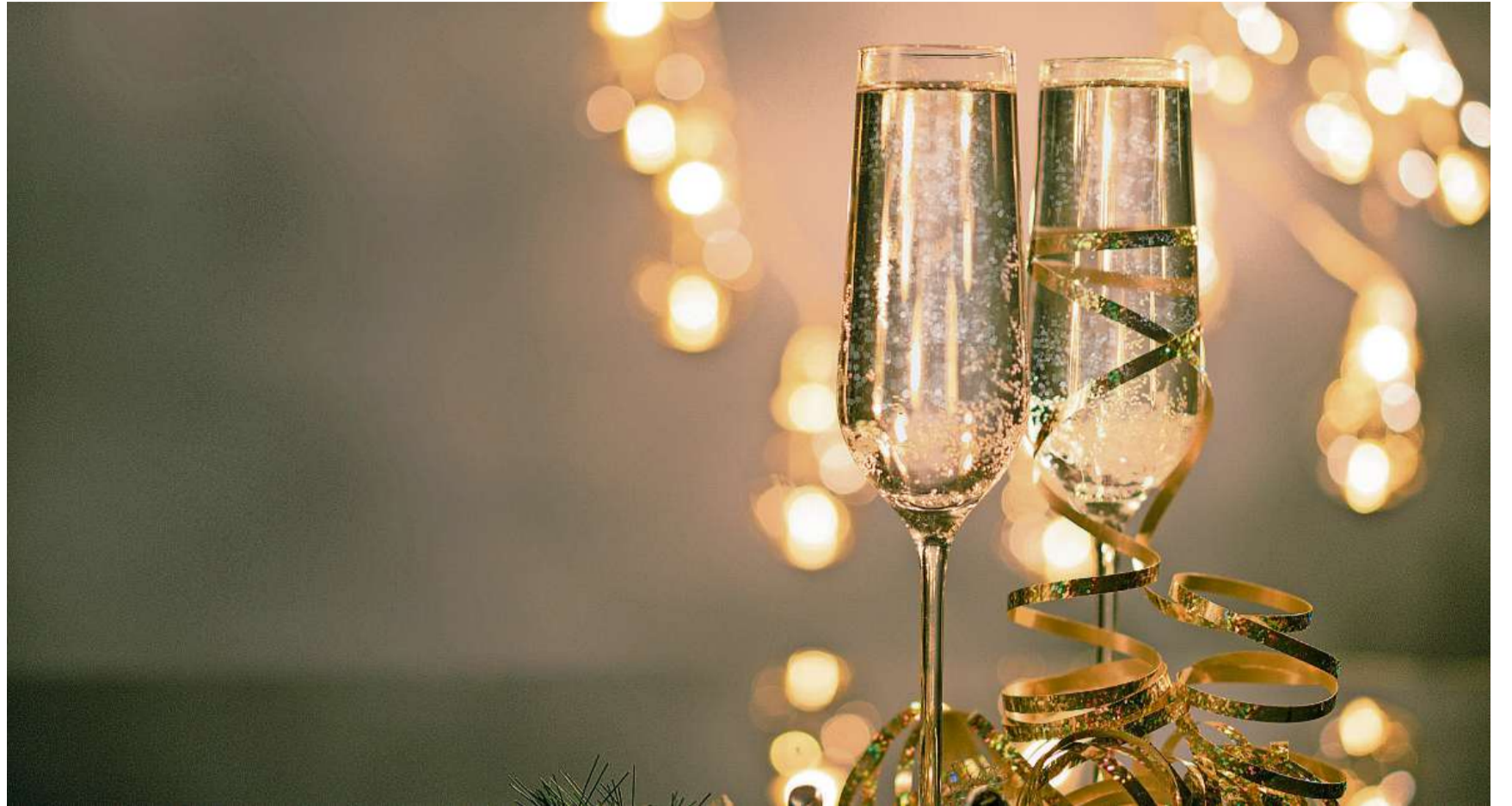
Im vergangenen Jahr war vielen Menschen nicht zum Feiern zumute. Dennoch gibt es Grund, auf ein gutes neues Jahr anzustossen.