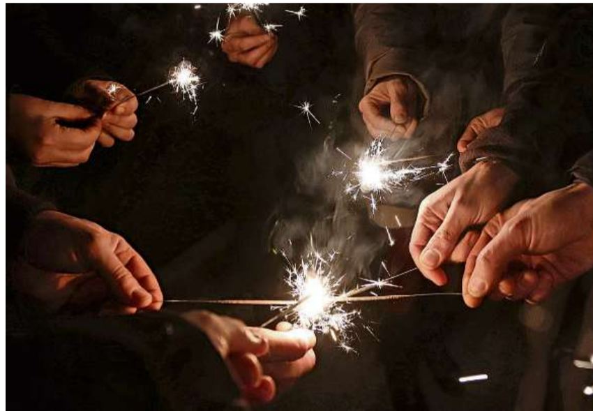
Zum Jahreswechsel sind viele optimistisch.

So nannten fast alle Befragten als erstes die Kriege in der Ukraine und in Palästina auf die Frage, was sie 2023 am meisten beschäftigt habe. Viele äusserten den persönlichen Eindruck, dass die Intoleranz zunehme. Erstaunlich war auch, dass das Thema Corona