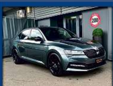
Skoda Superb 2.0 TDi Sportline 21er | 15 000 km | 5 J. Garantie | Navi | DAB nur Fr. 36'800.- | Mtl. ab 447.-*