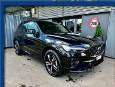
Volvo XC60 R-Design AWD 22er | 14 000 km | ACC | 360° Kamera | AHK nur Fr. 46'800.- | Mtl. ab 512.-*