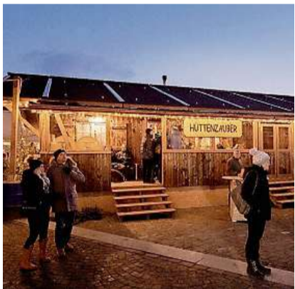
Neujahrsapéro im Chalet.

Rapperswil-Jona: Bereits Tradition hat der Neujahrsapéro der Stadt und der Ortsgemeinde Rapperswil-Jona zusammen mit Rapperswil Zürichsee Tourismus. Am Montag, 1. Januar 2024 trifft sich die Bevölkerung im Chalet «Hüttenzauber» auf dem Fischmarktplatz. Die Gäste erwartet eine Bündner Gerstensuppe, Punsch und Glühwein und die traditionelle Neujahrsrede von Stadtpräsident Martin Stöckling.