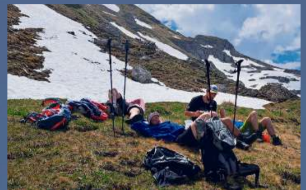
BC Linth abseits des Spielfelds