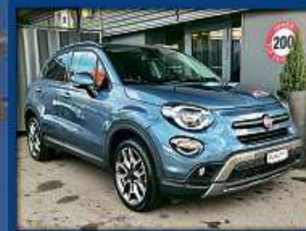
Fiat 500X 1.3 GSE Cross Aut. 19er | 53 000 km | ACC | LED | Teilleder | DAB nur Fr. 18'800.- | Mtl. ab 317.-*