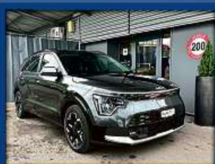
Kia Niro EV Power Edition 23er | 8 000 km | Head-Up | ACC | Sitzheizung nur Fr. 38'900.- | Mtl. ab 556.-*