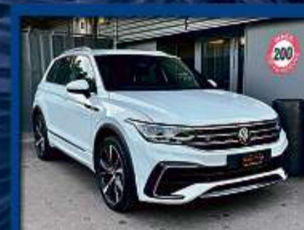
VW Tiguan 2.0 TDi R-Line 4M 21er | 29 000 km | AHK | Head-up | ACC | 20"Alu nur Fr. 44'800.- | Mtl. ab 460.-*