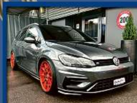
VW Golf Variant 2.0 TSi R 4M 20er | 14 000 km | BULL-X | AIRLIFT | Lufffahrwerk nur Fr. 42'800.- | Mtl. ab 601.-*