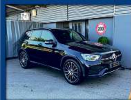
Mercedes GLC 220d AMG 4Matic 22er | 13 000 km | Glasdach | AHK | ACC nur Fr. 53'800.- | Mtl. ab 609.-*