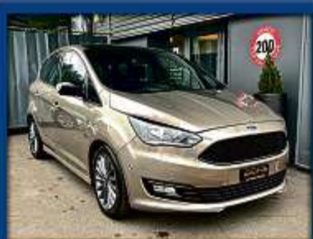
Ford C-Max 2.0 TDCi Aut. 20er | 26 000 km | Sitzheizung | Navi | DAB nur Fr. 26'800.- | Mtl. ab 357.-*