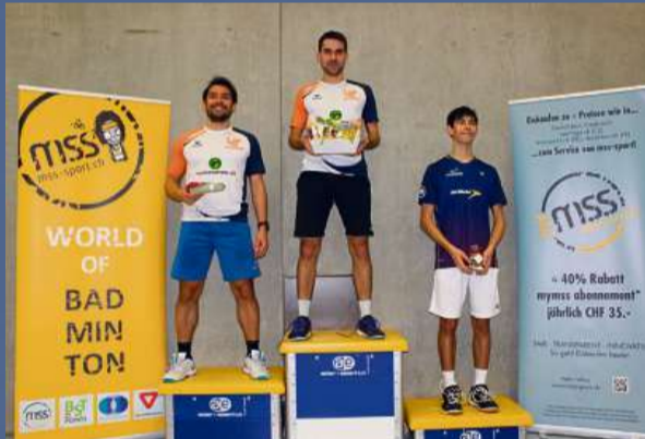
Die letztjährigen Podestplätze des Herren Einzels