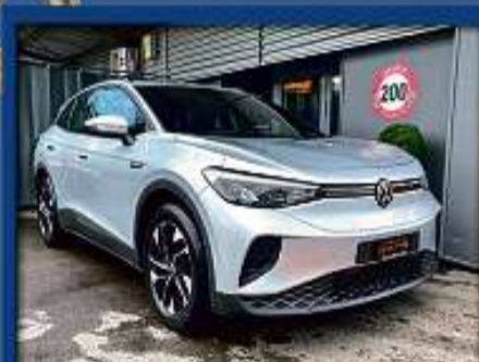
VW ID.4 Pure Perform. 55 kWh NEUWAGEN | Navi | ACC | Bluetooth | Sitzheizung nur Fr. 38'800.- | Mtl. ab 539.-*