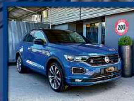
VW T-Roc 2.0 Sport 4M R-Line 21er | 26 000 km | Teilleder | ACC | 19"Alu nur Fr. 36'800.- | Mtl. ab 553.-*