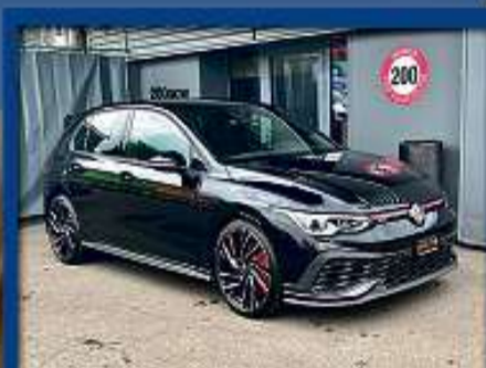
VW Golf 2.0 TSi GTI Clubsport 22er | 26 000 km | IQ-LED | ACC | Virtual Cockpit nur Fr. 37'800.- | Mtl. ab 507.-*