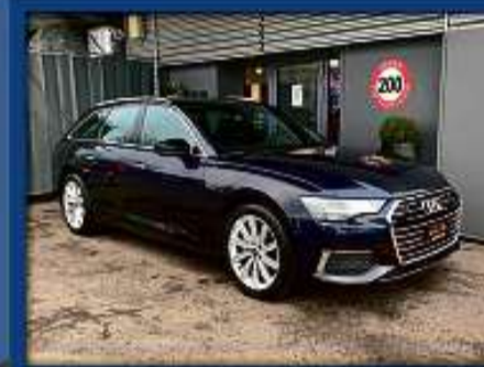
Audi A6 Avant 40 TDi quattro 21er | 39 000 km | ACC | LED | Kamera nur Fr. 44'800.- | Mtl. ab 423.-*