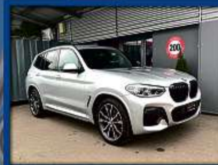
BMW X3 xDrive 30d M Sport 22er | 26 000 km | Standheizung | AHK | LED nur Fr. 59'800.- | Mtl. ab 799.-*