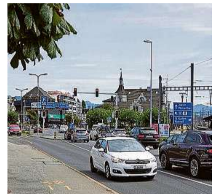
Meilenstein für Rapperswil-Jona: Tunnel-JA.

Die Gemeinde Eschenbach hat 2023 die 10 000er-Marke geknackt und versinnbildlicht das Wachstum in der Region See-Gaster. So ziemlich alle Gemeinden konnten zulegen, zum Teil auch die Steuern senken. Das Bevölkerungswachstum, respektive die Zuwanderung, bringen den Gemeinden neue Herausforderungen. Sei es in den Themen Verkehr, Gesundheitswesen und bezahlbarer Wohnraum, aber auch beim Besetzen von Arbeitsstellen mit Fachpersonal. Die «Obersee Nachrichten» haben darüber berichtet, wie sich die Gemeinden mit der Organisation Region Zürichsee-Linth vernetzen.