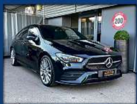
Mercedes CLA SB 220d AMG Line 21er | 19 000 km | Standheizung | LED | Glasdach nur Fr. 42'800.- | Mtl. ab 611.-*