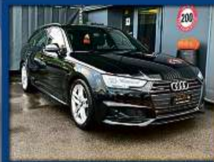
Audi A4 Avant 3.0 TDi quattro 19er | 79 000 km | 5 Line | Gratis Service | ACC nur Fr. 29'800.- | Mtl. ab 475.-*