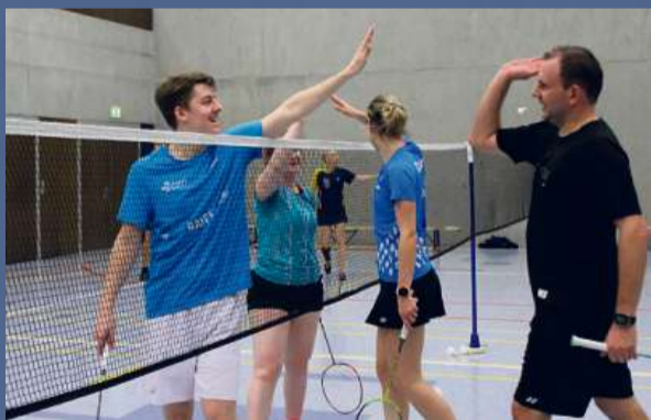
Fairplay und Spass stehen am Turnier im Fokus

Seit über 30 Jahren organisiert der Badminton Club Linth Näfels mit viel Herzblut den Fridolin Cup als nationales Badmintonturnier. Der Näfeler Verein führt diesen ehrenamtlich und aus Liebe zum Verein, zum Badminton und der Förderung des Glarner Sportangebots, durch.