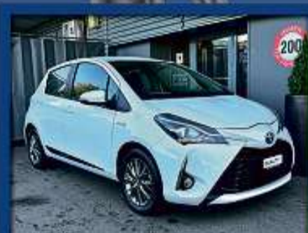
Toyota Yaris 1.5 VVT-i Hybrid 21er | 43 000 km | Kamera | Navi | Sitzheizung nur Fr. 17'900.- | Mtl. ab 312.-*