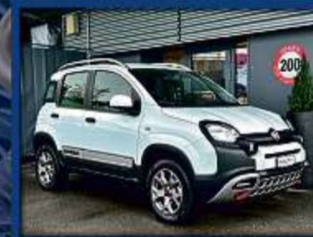
Fiat Panda 0.9 Turbo Cross 4x4 15er | 109 000 km | Teilleder | ISOFIX | 15"Alu nur Fr. 9'800.- | Mtl. ab 148.-*