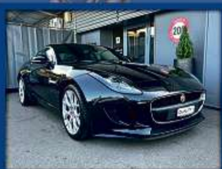
Jaguar F-Type Coupé 3.0 340 PS 17er | 83 000 km | Leder | 19"Alu | Xenon nur Fr. 45'800.- | Mtl. ab 442.-*