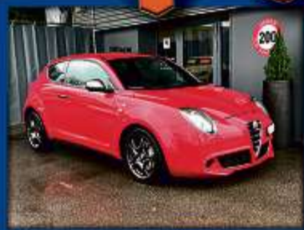
Alfa Romeo MiTo 1.4 QV Aut. 17er | 59 000 km | Navi | Bluetooth | DAB nur Fr. 12'800.- | Mtl. ab 216.-*