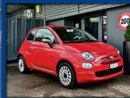
Fiat 500 1.0 N3 MHD Cult 70 PS NEUWAGEN | DAB | Navi | Bluetooth | Tempomat nur Fr. 14'900.- | Mtl. ab 213.-*