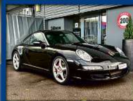
Porsche 911 Carrera 4S Aut. 107er | 79 000 km | Xenon | Navi | Schiebedach nur Fr. 49'800.- | Mtl. ab 636.-*