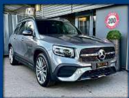
Mercedes GLB 220d 4Matic AMG 22er | 13 000 km | LED | 20"Alu | Virtual cockpit nur Fr. 57'800.- | Mtl. ab 728.-*