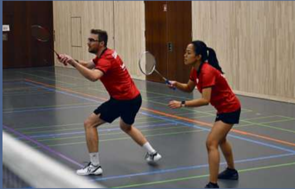
Spannung am Fridolin Cup

Der Fridolin Cup findet jedes Jahr am ersten Januar-Wochenende in der lintharena in Näfels statt. Das nationale Ranglistenturnier zählt bis heute zu den traditionsreichsten Austragungen des Badmintonkalenders der Schweiz und lockt jedes Jahr Badmintonspieler/-innen aus dem ganzen Land an. Dieses Jahr feiert der Fridolin Cup sein 30. Jubiläum, worauf sich das Organisationskomitee des BC Linth Näfels besonders freut. Es werden an die 200 Spieler/-innen und viele Zuschauer/-innen über beide Turniertage des 6. und 7. Januars 2024 erwartet. Wie jedes Jahr wird von allen Teilnehmenden nicht nur die hervorragende Organisation geschätzt, sondern auch die Glarner Spezialitäten des Gabentisches sind hoch im Kurs. Dies treibt die Teilnehmenden zur Ergatterung eines beliebten Podestplatzes besonders an. Auch als Zuschauer kommt man nicht zu kurz ... gerne kann man sich von Athletinnen und Athleten, oder der Sportart überzeugen lassen, oder sich auch nur einen Kaffee, oder einen Teller Pasta am Turnier-Buffer gönnen. Alle Zuschauer/-innen sind ganz herzlich in der lintharena Willkommen.