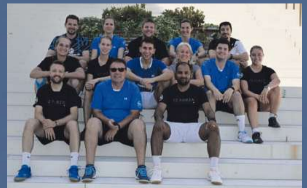
Delegation des BC Linths am diesjährigen Trainingsweekend in Sursee, LU