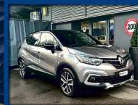
Renault Captur 1.3 TS-Ed. Aut. 18er | 29 000 km | LED | Bluetooth | Sitzheizung nur Fr. 17'800.- | Mtl. ab 289.-*