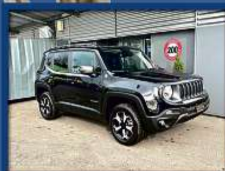
Jeep Renegade 1.3 T PHEV AWD 22er | 18 000 km | Leder | 19"Alu | Xenon nur Fr. 36'800.- | Mtl. ab 523.-*