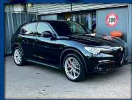
Alfa Romeo Stelvio 2.2 Q4 19er | 19 000 km | Leder | 20"Alu | Kamera nur Fr. 37'800.- | Mtl. ab 619.-*