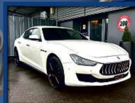
Maserati Ghibli 3.0 Automatica 21er | 84 000 km | ACC | 21"Alu | 360°Kamera nur Fr. 47'800.- | Mtl. ab 527.-*