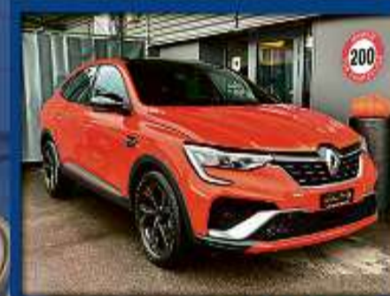
Renault Arkana 1.3 R.S. Line 22er | 15 000 km | ACC | LED | Leder/Alcantara nur Fr. 28'800.- | Mtl. ab 369.-*