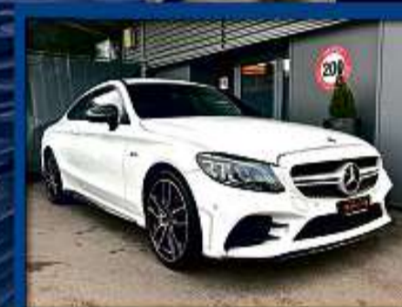
Mercedes C 43 AMG 4Matic 390 PS 20er | 48 000 km | Gratis Service | AMG Perform. nur Fr. 52'800.- | Mtl. ab 658.-*